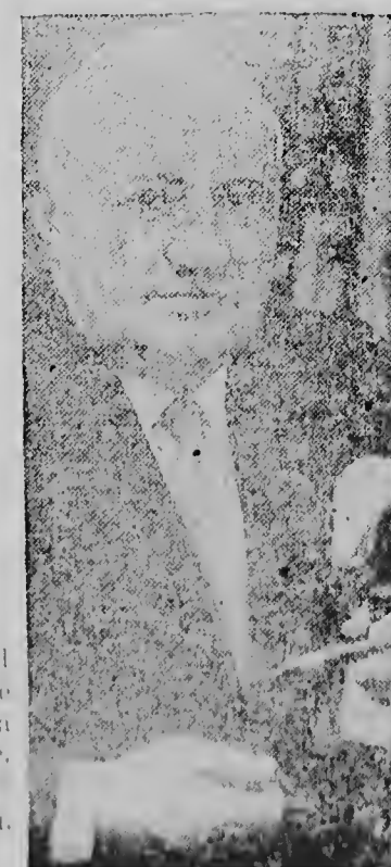
ARTHUR GARDNER, 64 jaar oud is door President Eisenhower benoemd als Amerikaanse Ambassadeur op Cuba. De benoemde, Republikein, was van 1946 tot 1948 onderminister van Financien.